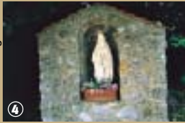
Chapelle en pierre bleue - Hon-Hergies.

ou sur les oratoires, ces chapelles qui se dressent à la croisée des chemins, le plus souvent dédiées à la Vierge ou à un saint local, en vue de bénéficier d'une éventuelle protection divine. Le circuit – qui porte bien son nom – mènera ainsi les randonneurs à la Chapelle de la Tourelle, à la chapelle Sainte Philomène, à la chapelle du Court Tournant et encore celle du Pissautiau.