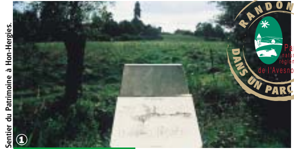
Sentier du Patrimoine à Hon-Hergies.

Bavais, Pays Quercitain, forêt de Mormal, 2000 ans d'histoire à contempler