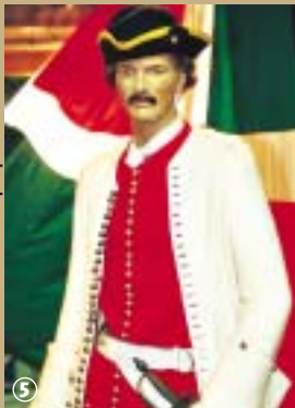
Musée de la Bataille de Malplaquet.

Entre Hon-Hergies et Tasnières-sur-Hon eut lieu, lors de la succession d'Espagne, l'une des batailles les plus sanglantes de l'Histoire.