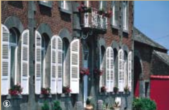
Habitat en brique en pierre bleue.

Hon-Hergies est l'un des derniers villages de la vallée de l'Hogneau où l'on travaille encore de manière traditionnelle la pierre bleue ou le marbre noir. Les traces de ce savoir-faire s'observent aujourd'hui sur les façades des maisons